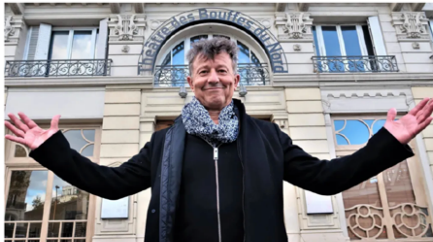
C'est parti pour vingt-deux représentations du diptyque « Ma langue mondiale ».

Le conteur poitevin présente, depuis jeudi, ses deux derniers spectacles en vingt-deux représentations, aux Bouffes du Nord à Paris. Un sacré défi.