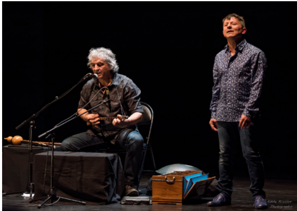
DE ET PAR YANNICK JAULIN